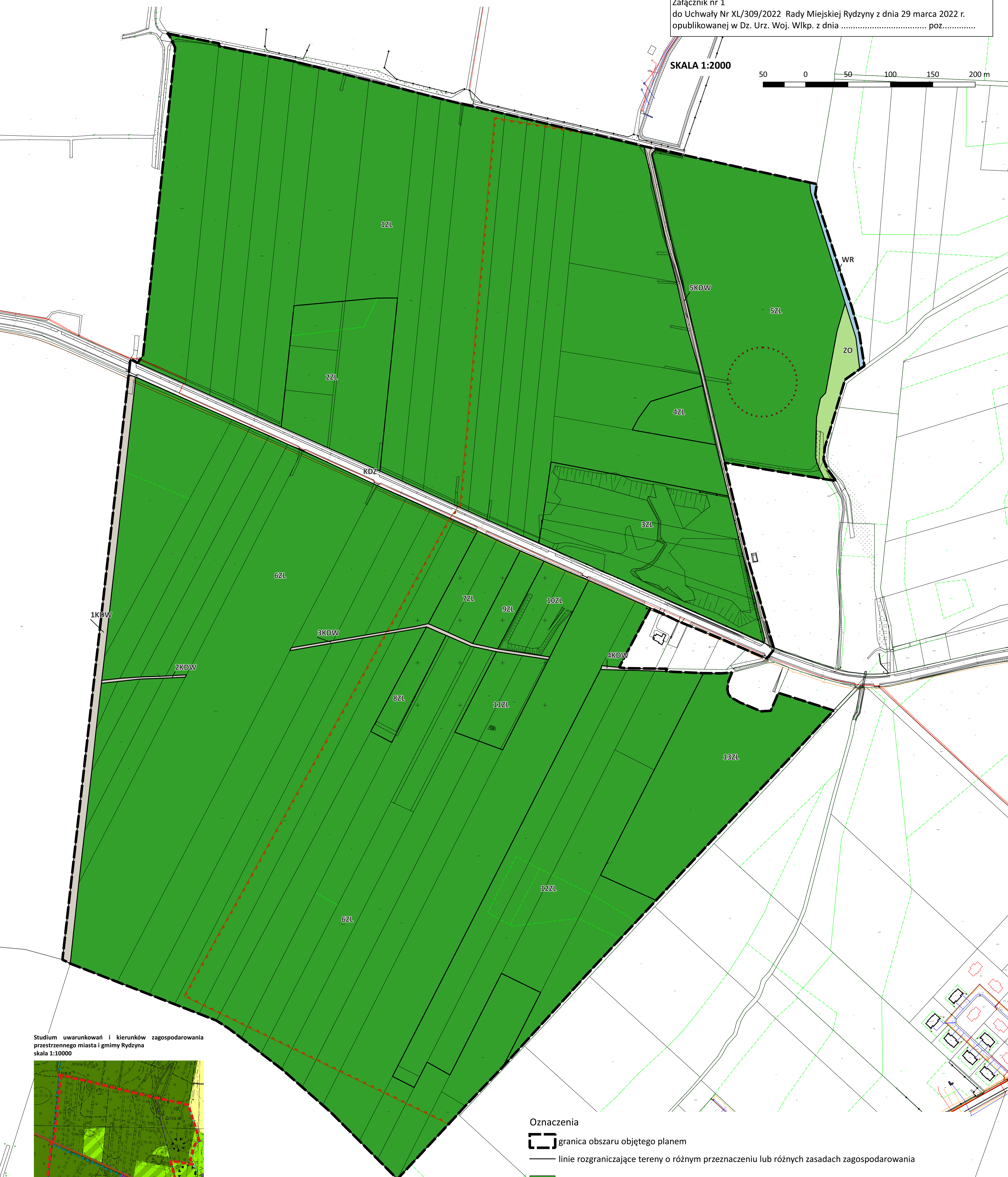
Studium uwarunkowań i kierunków zagospodarowania przestrzennego miasta i gminy Rydzyna skala 1:10000