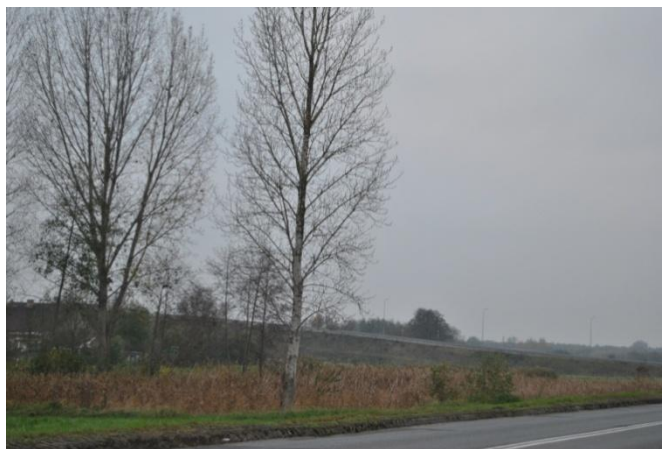
Stawy z terenem do zagospodarowania