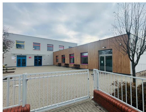
Szkoła Podstawowa im. Tadeusza Łopuszańskiego