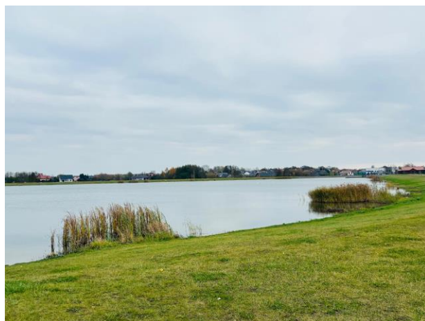
Zalew w Dąbczu