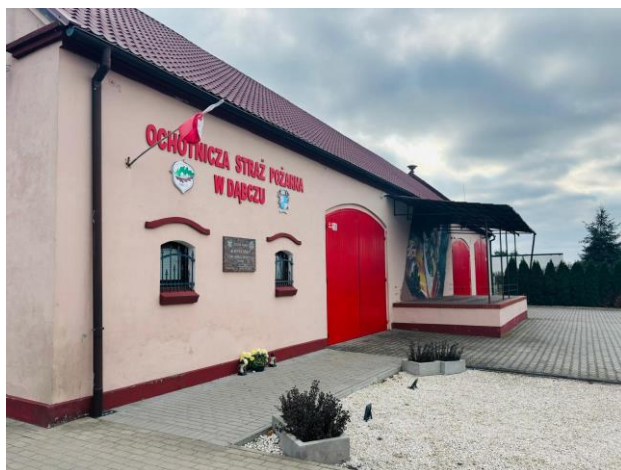
Remiza OSP w Dąbczu