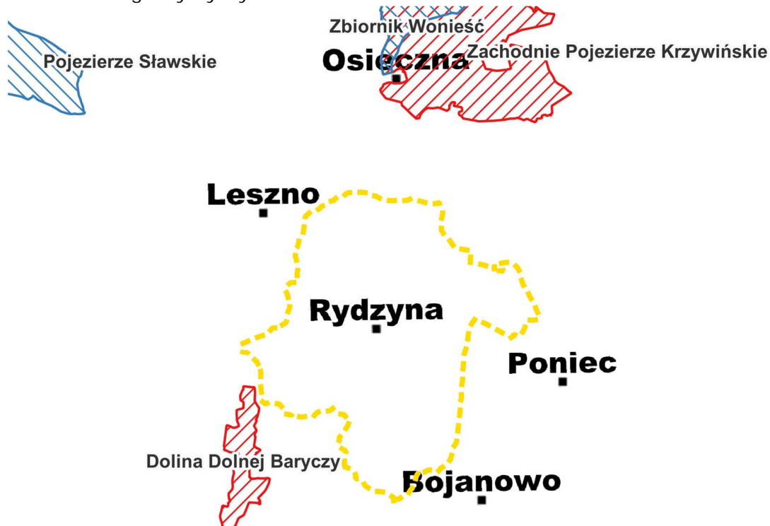
Ryc. 6. Położenie gminy Rydzyna na tle Obszarów Natura 2000