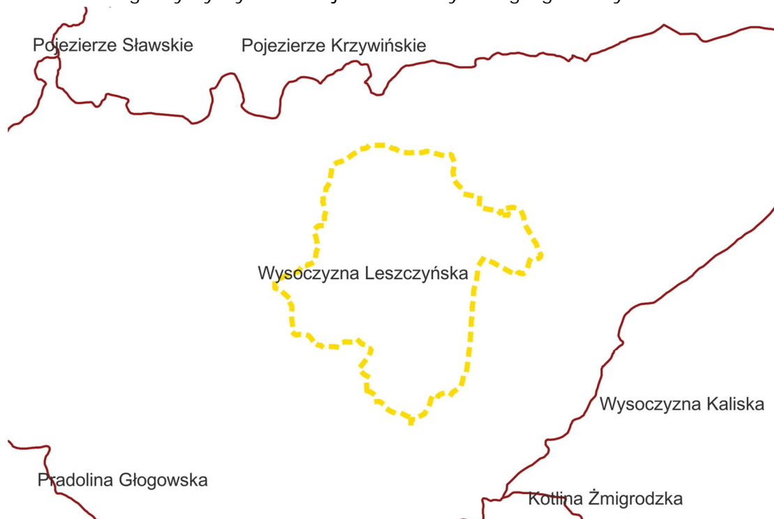
Ryc. 2. Położenie gminy Rydzyna na tle jednostek fizyczno-geograficznych