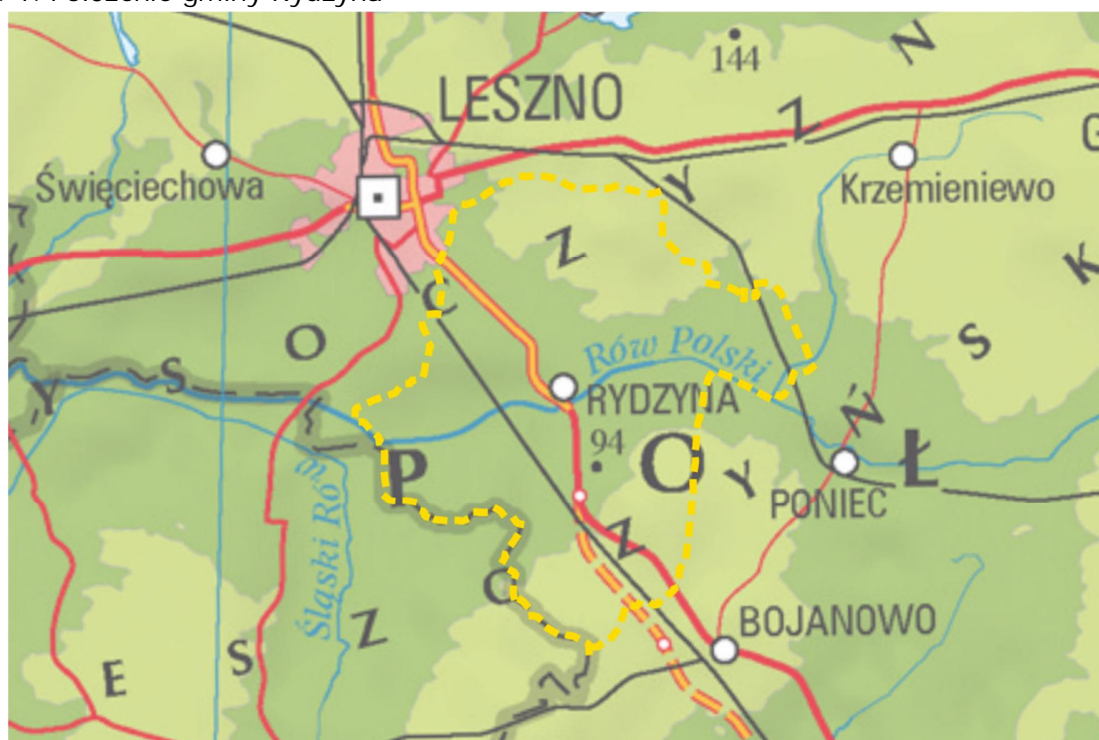
Ryc. 1. Położenie gminy Rydzyna