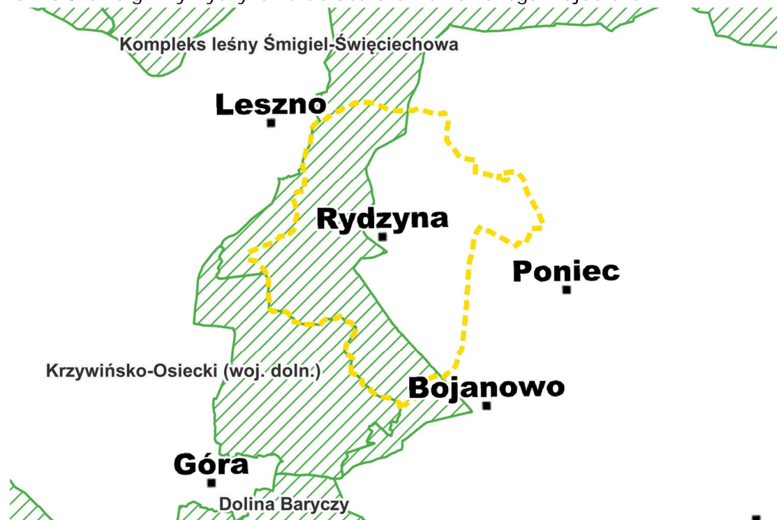
Ryc. 5. Położenie gminy Rydzyna na tle obszarów chronionego krajobrazu