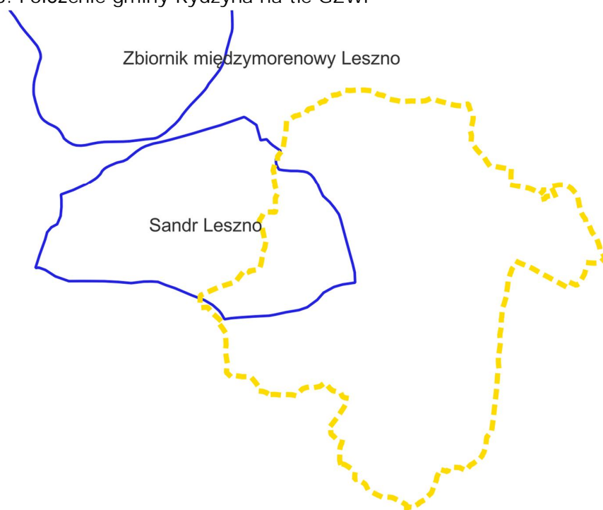
Ryc. 3. Położenie gminy Rydzyna na tle GZWP